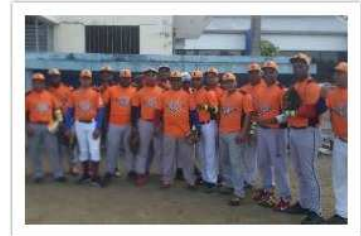
Arrocera Los Cuatrillizos