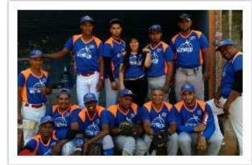
Iglesia Metodista Libre