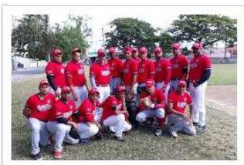
Edilio Auto Parts