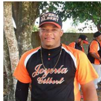
Elvis Serrano Joyeria Gilbert 14