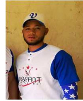
Yariel Minaya Vibrant Lounge Bar 10