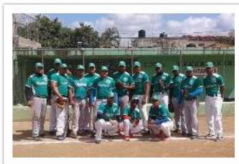
Cerv. Nac. Dom.