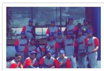
Casa Vieja Gas