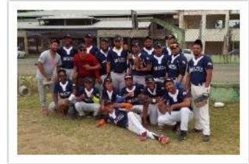
Alpha Prom. Inmobiliarios