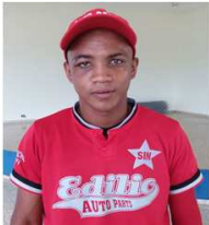
Genesis Sanchez Edilio Auto Parts 6