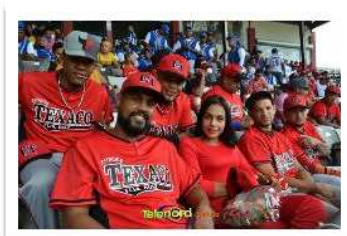
Estación Texaco Hnos. Díaz