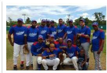
Roberto Auto Import