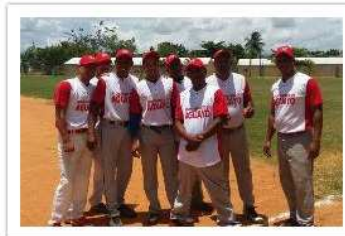
Ayuntamiento de Aguayo