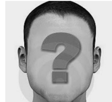
Wilson De La Cruz Movil Soluciones 5 - 0