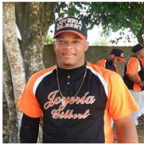
Elvis Serrano Joyeria Gilbert 19