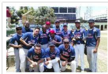
Oficina Jurídica Imbert