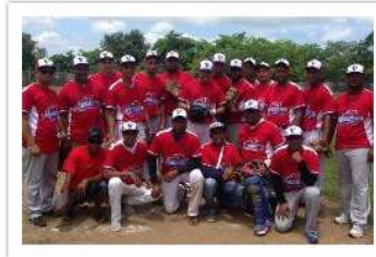
Cabaña Villa Macorisana