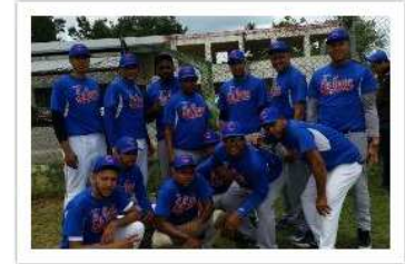
Cafetería La Joya