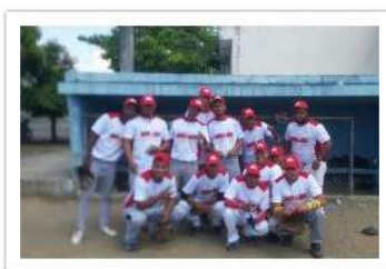
David y Brot Motors