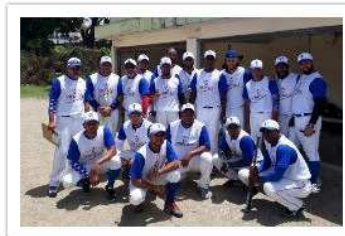
Vibrant Lounge Bar