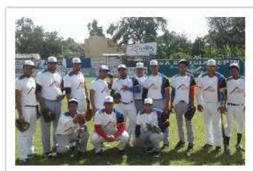
Casa del Oro