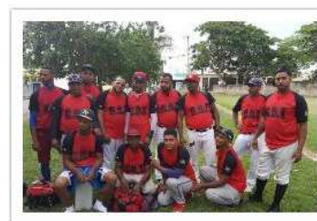
Club Olegario Tenares