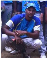
Domingo Nuñez Impresos Norte 8