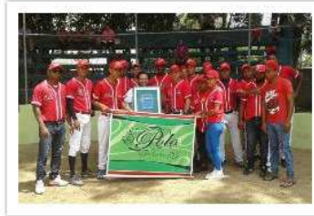
El Polo Café