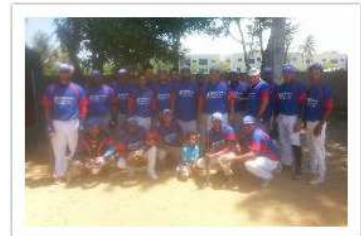
Auto Pintura Edward