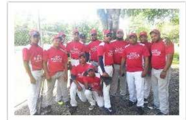
Supermercado Gran Porvenir