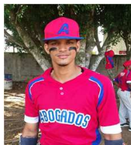
Starlin Alcantara Abogados 3