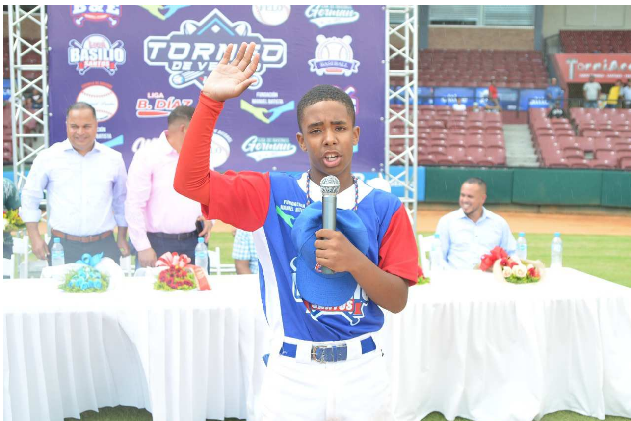
Representante del equipo Liga Basilio Santos