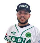
Bresaler Minaya Codia 18